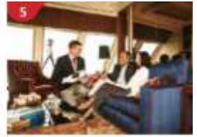
The Palace Indulge in European-style butler service and exclusive facilities.