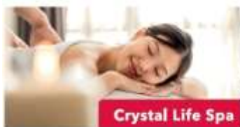
Crystal Life Spa