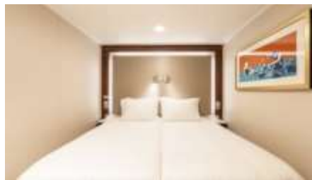
พัก 1-2 ท่าน

From 13 - 14 sq.m Max Occupancy 2-4 ^ Deck 5/8/9/10/11/12/13/15 2 Single Beds / 2 Single Beds + 1 Ceiling Pullman Bed / 1 Single Bed + 1 Pullman Bed + 1 Double Sofa Bed