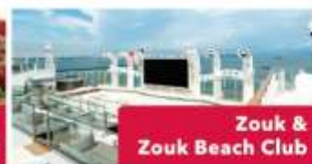
Zouk & Zouk Beach Club