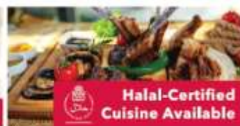
Halal-Certified Cuisine Available