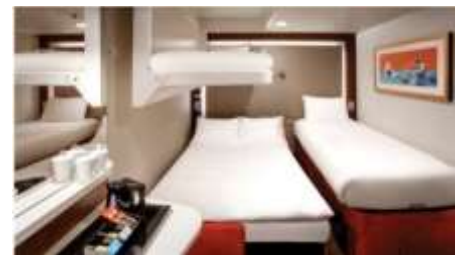
พัก 3-4 ท่าน