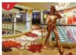
Johnnie Walker House™ Immerse yourself in the intricate world of premium Scotch whisky.