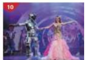
Zodiac Theatre Enjoy live production shows from the acclaimed award-winning entertainment team.