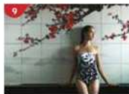
Crystal Life™ Spa Rejuvenate mind, body and soul with our holistic Western and Asian spa experience.