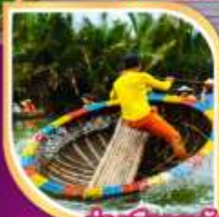
ล่องเรือกระด้ง