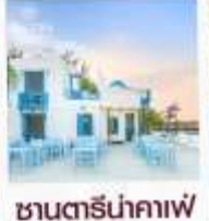
ซานตารีน่าคาเฟ่