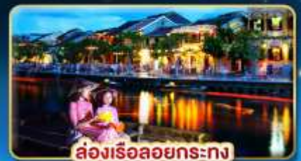
ส่องเรือลอยกระทง