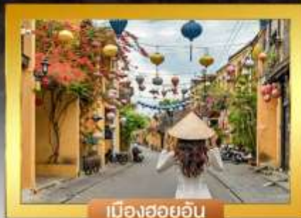
เมืองฮอยอัน