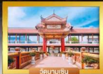
วัดนามเซิน