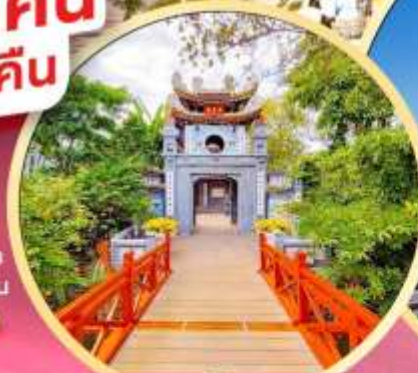
วัดห็อกเซิน