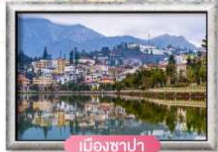
เมืองซาปา