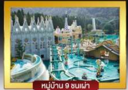
หมู่บ้าน 9 ชนเผ่า