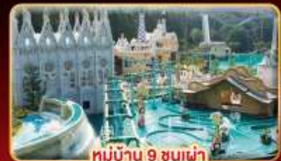
หมู่บ้าน 9 ชนเผ่า