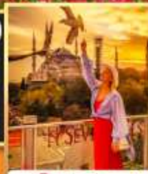
ลูฟฟือปเซเวนฮิลส์