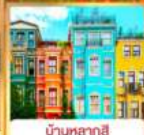
บ้านหลากสี คิสเลอร์ฟู