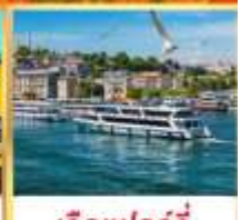
เรือเฟอร์รี่

เที่ยวครบเส้นทางยอดนิยม บินเข้าถึงเย็น เช้าชมสุเหร่ายักษ์คามลิก้า และล่องเรือเฟอร์รี่ ชมเทศกาลทิวลิปแห่งนครอิสตันบูล