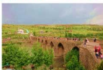
สะพานสิบโค้ง