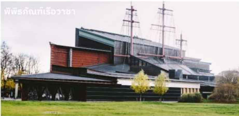
พิพิธภัณฑ์เรือวาซา