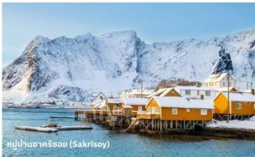
หมู่บ้านซาคริซอย (Sakrisoy)

จากนั้นนำท่านเดินทางต่อไปยัง หมู่บ้านซาคริซอย (Sakrisoy) ใช้เวลาเดินทางประมาณ 15 นาที