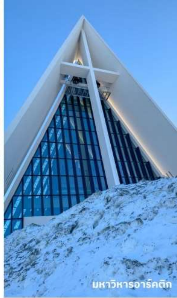
มหาวิหารอาร์คติก

จากนั้นนำท่านถ่ายรูปเป็นที่ระลึกกับอีกหนึ่งโบสถ์ที่สำคัญของเมืองทรอมโซ่