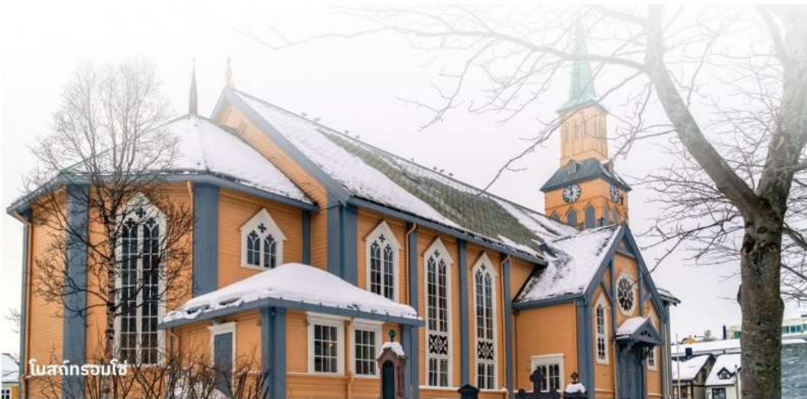
โบสถ์ทรอมโซ่

เป็นโบสถ์ที่ตั้งอยู่ใจกลางเมืองทรอมโซ่ มีสถาปัตยกรรมสวยงาม และเป็นโบสถ์ไม้ที่ใหญ่ที่สุดในนอร์เวย์ สถานที่นี้ไม่เพียงแต่เป็นที่สักการะ แต่ยังเป็นจุดท่องเที่ยวที่มีความสำคัญทางวัฒนธรรมอีกด้วย