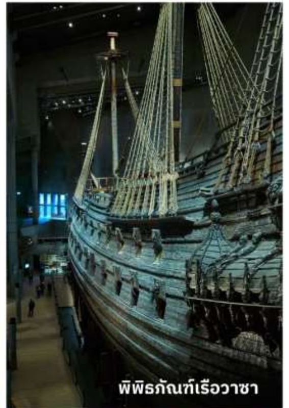
พิพิธภัณฑ์เรือวาซา

เรือลำนี้ได้ถูกยกขึ้นมาจากใต้ทะเลโดยใช้เทคนิคพิเศษที่มีความทันสมัย และได้้นำเรือวาซาลำดังกล่าวมาจัดแสดงเป็นพิพิธภัณฑ์ ทุกท่านจะได้พบกับเรือ Vasa ขนาดใหญ่ และจะได้ชมโครงสร้างของเรือ, ประวัติของการสร้างและสถานการณ์ที่ทำให้เรือล่มรวมถึงเรียนรู้เรื่องราวต่างๆ ที่เกี่ยวข้องกับ Vasa ได้อย่างลึกซึ้ง