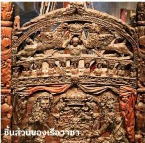
ชิ้นส่วนของเรือวาซา