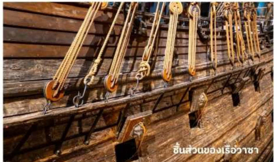
ชิ้นส่วนของเรือวาซา