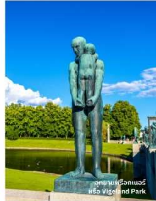
อุทยานฟรีกเนอร์ หรือ Vigeland Park

จากนั้นนำท่านถ่ายรูปด้านนอก ปราสาท Akershus งานสถาปัตยกรรมอันเก่าแก่ในยุคเรอเนสซองส์ และนำท่านเที่ยวชม กรุงออสโล นครเก่าแก่อายุกว่า 1,000 ปี เป็นเมืองหลวงมาตั้งแต่สมัยไวกิงเรื่องอำนาจ ผ่านชมทำเนียบรัฐบาล พระบรมมหาราชวังที่ประทับของพระมหากษัตริย์แห่งนอร์เวย์