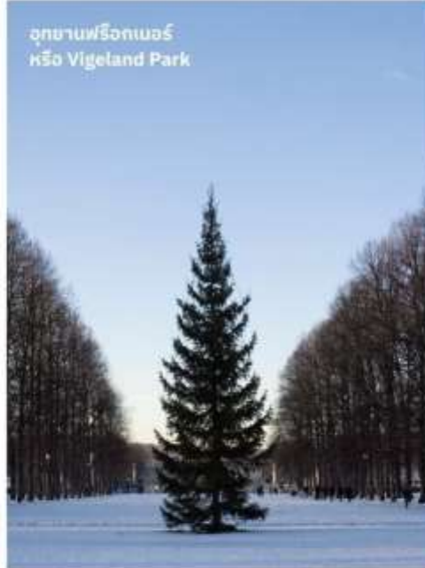
อุทยานฟรีกเนอร์ หรือ Vigeland Park

เป็นสวนสาธารณะที่มีชื่อเสียงในเมืองออสโล เป็นสวนที่จัดแสดงงานประติมากรรมของศิลปินชื่อดังชาวนอร์เวย์ชื่อ Gustav Vigeland ซึ่งประกอบไปด้วยงานประติมากรรมมากกว่า 200 ชิ้น ซึ่งเน้นที่ศิลปะที่เป็นธรรมชาติและมนุษย์ทำให้ Frogner Park เป็นสถานที่ท่องเที่ยวที่น่าสนใจอย่างมากในออสโล