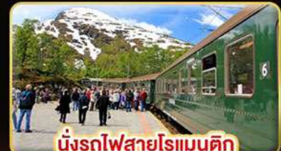
นั่งรถไฟสายโรแมนติก “พร้อมสปา”