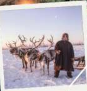
เมืองก็รอฟสค์