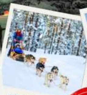
สุนัขฉัลท์ลากเลื่อน