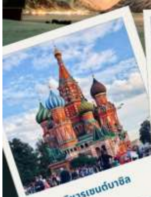
วิหารเซนต์บาซิล