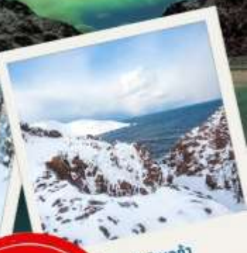
เทอริเบอก้า