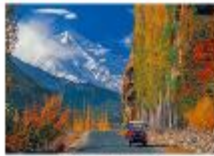
เมืองชิลาส

** พักที่ Shangrila Chilas Hotel หรือเทียบเท่า **