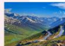
หุบเขา Naran Kaghan

** พักที่ Besham Hilton Hotel หรือเทียบเท่า **