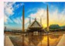
มัสยิดไฟซาล

DAY8 ตักศิลา-พิพิธภัณฑ์ตักศิลา-อิสลามาบัด- มัสยิดไฟซาล-Shopping-กรุงเทพ