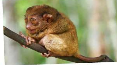
ลิงทาร์เซียร์