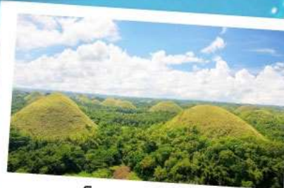
ช็อคโกแลตฮิลล์