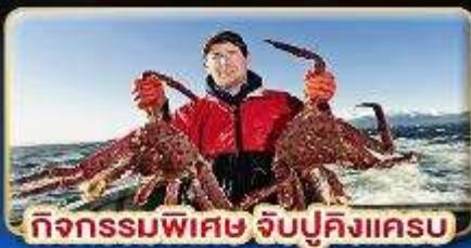
กิจกรรมพิเศษ จับปูคิงแครม