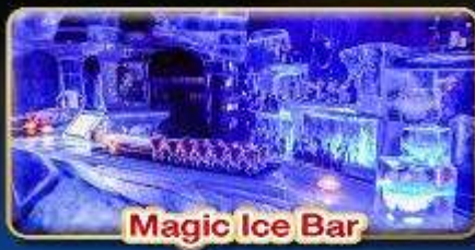
Magic Ice Bar