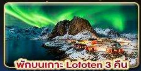
พักผ่อนเกาะ Lofoten 3 คืน