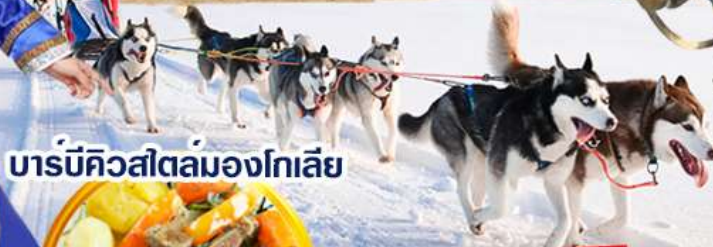
บาร์บีคิวสเตอ์มองโกเลีย