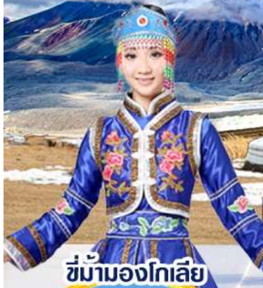
ชีม้ามองโกเลีย