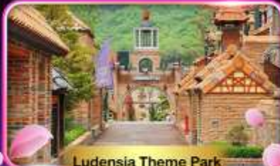
Ludensia Theme Park