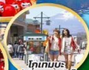
โทเกมะ- พรีเมียมเอาก์เล็ต