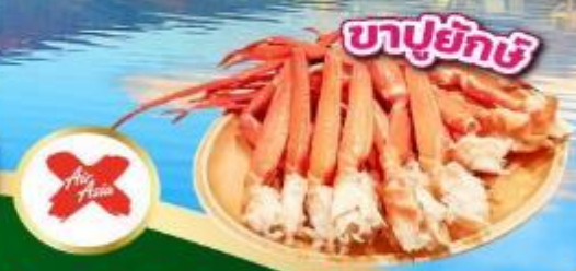
บาปูยกซ์