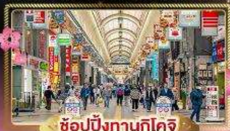
ช้อปปิ้งทานุกิโคจิ