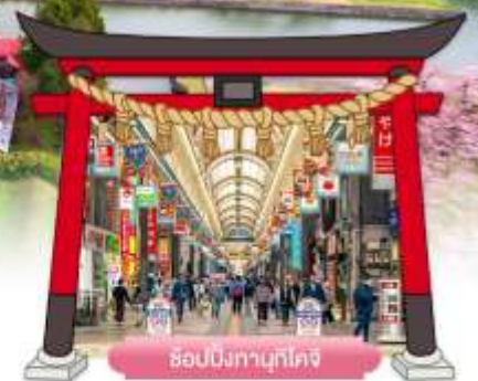
ช้อปปิ้งทานุกิโคจิ