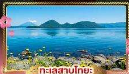
ทะเลสาบโทโย

ชมวิวซากุระบนยอดหอคอยสูง 107 เมตร Goryokaku Tower