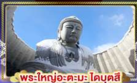
พระใหญ่อะตะมะโดบุตสึ