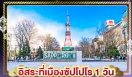
อิสระที่เมืองซัปโปโร 1 วัน