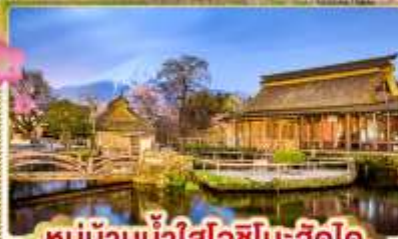
หมู่บ้านน้ำใสโอชิโนะฮัคโค

✓ สักการะพระใหญ่อุซึคุไดบุตสึ ท่ามกลางซากุระ