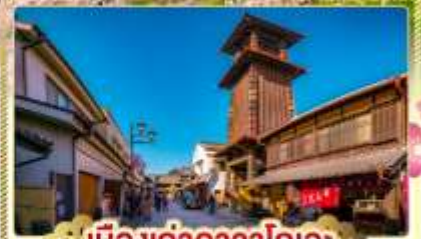
เมืองเก่าคาวาโกเอะ