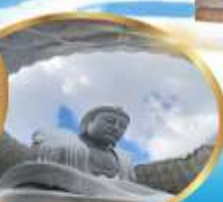
เม่นเขาพระพุทธรเจ้า