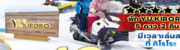
พัท YU KIRORO 5 ดาว 2 คืน