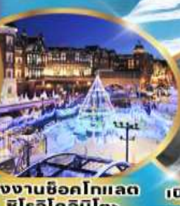
โรงงานช็อคโกแลต ชิโรโคโนโปะ