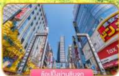
ช้อปปิ้งย่านชินจูกุ