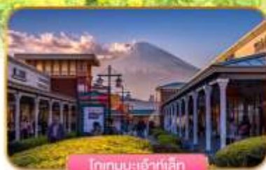
โทกอนบะเจ้าท์เส็ท