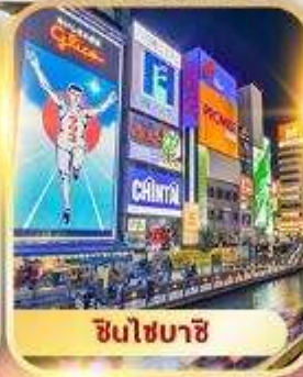
ชินโซบาชิ