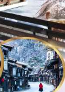
หมู่บ้านโบราณ นาระอิ จุกุ