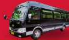
BUS (10-18 ท่าน)