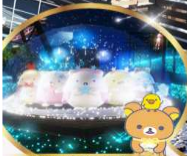
ซากาฮิโกะ อิลลูมินาเลี่ยน สัมถำร์ตุนสุดน่ำร์ทจากสำย SAN-X