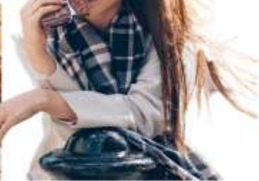
โรงงานช็อคโกแลต "อิชิยะ" (Ishiya Chocolate Factory)

ท่านสามารถชมขั้นตอนการทำช็อคโกแลตที่ขึ้นชื่อของเมืองซัปโปโร โดยเฉพาะSHIROI KOIBITO ขนมสอดไส้ช็อคโกแลตขาวที่เป็นที่นิยมทั่วทั้งเกาะฮอกไกโด และพิพิธภัณฑ์ช็อคโกแลต ชมถ้วยชามที่ใช้สำหรับใส่ช็อคโกแลตที่มีความสวยงามเป็นเอกลักษณ์ และเหล่าของเล่นย้อนยุคที่ทำให้คุณ ๆ ต้องแอบอมยิ้มอยู่ในใจ และรู้สึกเหมือนย้อนเวลากลับไปในอดีตอีกครั้ง และแนะนำให้ท่านชิมชา หรือกาแฟร้อนของที่นี่ พร้อมทั้งสิ่งขนมเค้กแสนอร่อยราดด้วยช็อคโกแลตเข้มข้น ในส่วนที่เป็นคอฟฟี่ช็อป บริเวณชั้น 2 ของอาคารทรงสไตล์ยุโรป (อิสระให้ท่านถ่ายรูปบริเวณด้านนอก ไม่รวมตัวค่าเข้าชมภายใน)