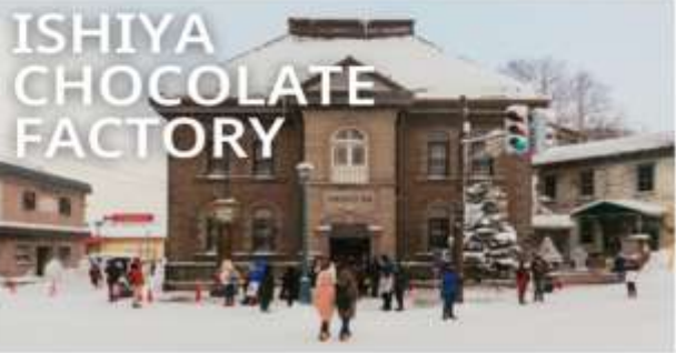
ISHIYA CHOCOLATE FACTORY