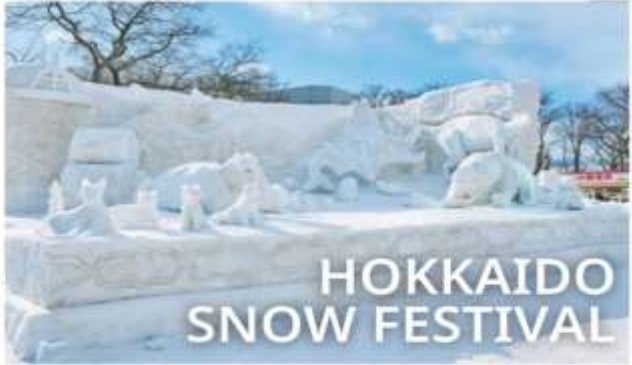
HOKKAIDO SNOW FESTIVAL