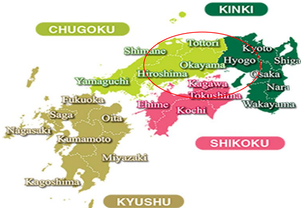
จังหวัด คางาวะ (KAGAWA) ตั้งอยู่บนเกาะชิโกกุ (SHIKOKU) 1 ใน 4 เกาะหลักของญี่ปุ่น