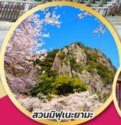
สวนมิฟูเนะยามะ