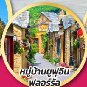
หมู่บ้านยูฟูอิน พลอร์ริล