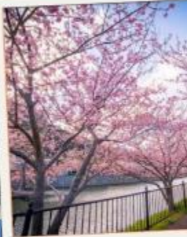
เทศกาลคาวาซุ ซากุระ