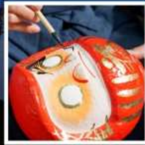
โรงงานตุ๊กตาดารุมะ