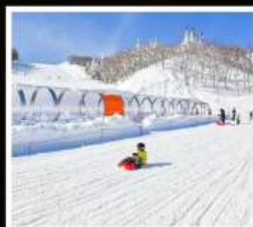
ลานสกี กาล่า ยูซาวะ