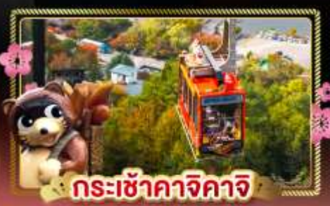
กระเช้าคางิจิคาจิ