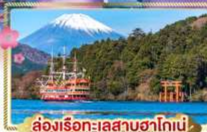
ล่องเรือทะเลสาบฮาโกเน่