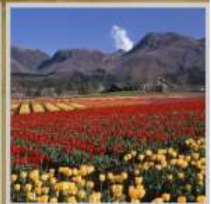
"KUJU HANA PARK"