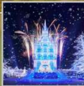
"HUIS TEN BOSCH"