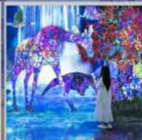
"TEAM LAB FOREST"