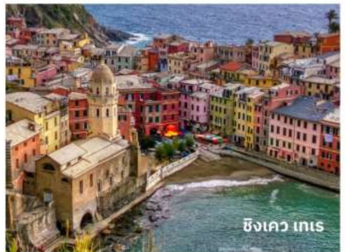
ซังควา เทเร

ท่านสามารถทำการสแกน QR CODE นี้ เพื่อรับชม “ซังควาเทเร” ในรูปแบบวิดีโอ