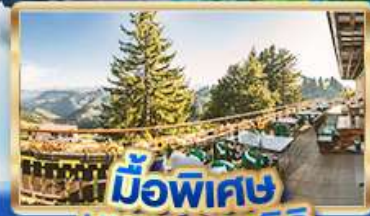
มือพิเศษ บียอดเวนิท