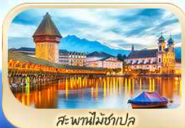
สะพานไมซ์ฮาเปล