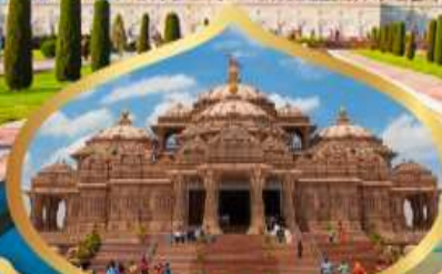
วิหารอักชาร์ดัม