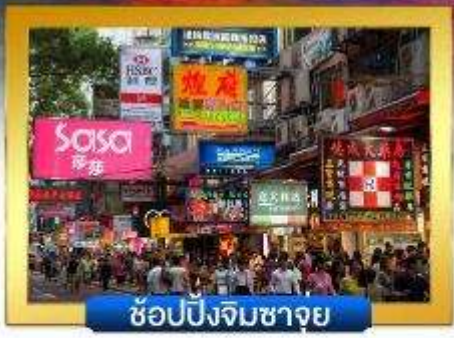
ช้อปปิ้งจิมซาจู้