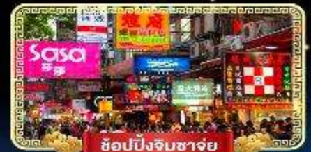
ช้อปปิ้งจิมซาจู้