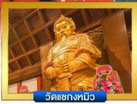
วัดเขangkงหมิว

📍 อิสระ-ช้อปปิ้งย่านจิมซาจู้ & คอสเวย์เบย์