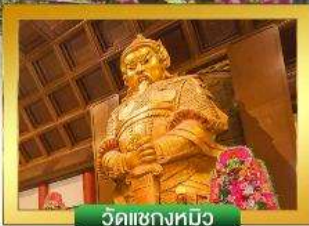
วัดเขกหมิว