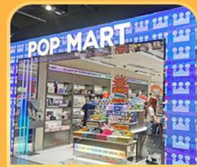
ช้อปปิ้ง POP MART