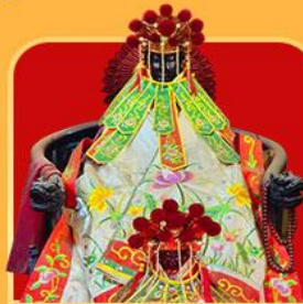
เจ้าแม่กวนอิมสองห้า