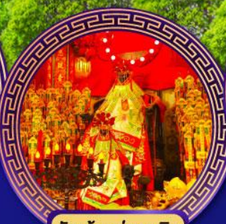
วัดเจ้าแม่กวนอิม ย่องฮ่า