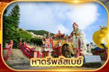
หาดริพลัสเบย์