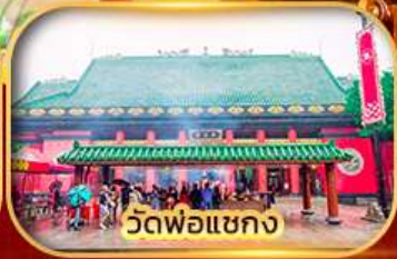
วัดพ่อแชกง