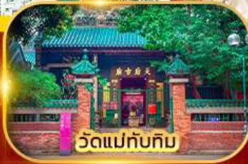
วัดแม่ทับทิม