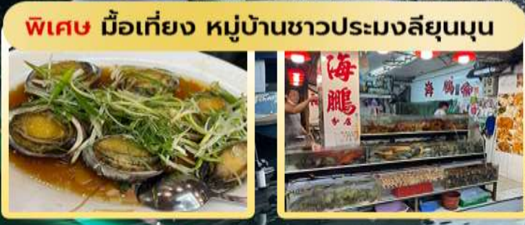
พิเศษ มือเที่ยง หมู่บ้านชาวประมงลิยูนุน