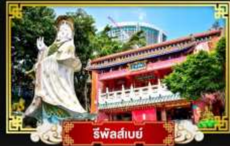
รีฟัลส์เบย์