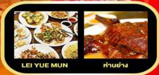
LEI YUE MUN