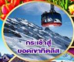
กระเช้าสู่ ยอดเขาทิลิส

เดินทาง 30 เม.ย.-09 พ.ค. 68 03-11 พ.ค. 68