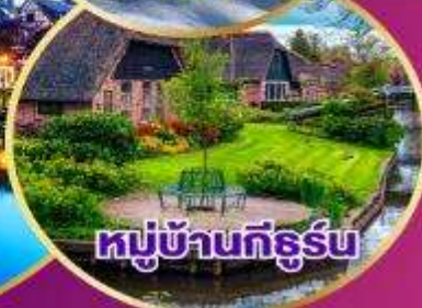
หมู่บ้านทีธูร์น