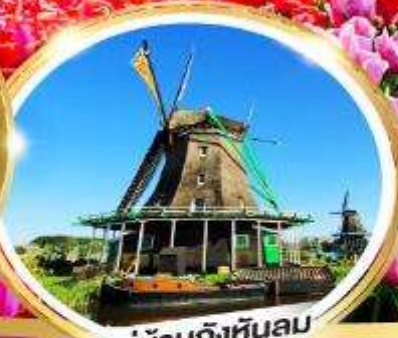
หมู่บ้านกังหันลม