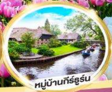
หมู่บ้านกีร์ธูร์น