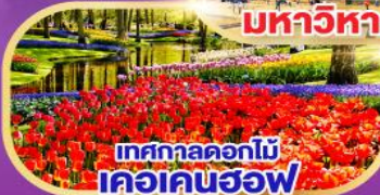
เทศกาลดอกไม้ เคอเคนฮอฟ

พิเศษ!! เมนูหอยแมลงภู่อบไวน์ขาวและขาหมูเยอรมัน