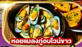
หอยแมลงภู่อบไวน์ขาว