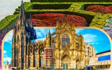
มหาวิหารโคโลญ