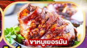
ขาหมูเยอรมัน

พิเศษ!! เมนูหอยแมลงภู่อบไวน์ขาวและขาหมูเยอรมัน