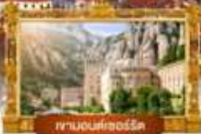
ภูเขาโดโลมิตี