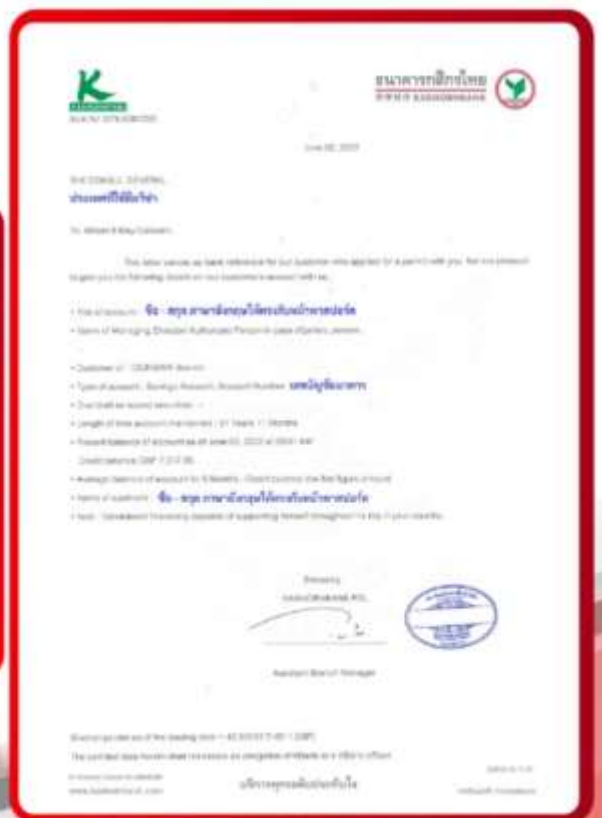
ตัวอย่าง Bank Guarantee ที่ผู้สมัครต้องขอจากธนาคาร