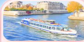
คลองเรือแม่น้ำเซน